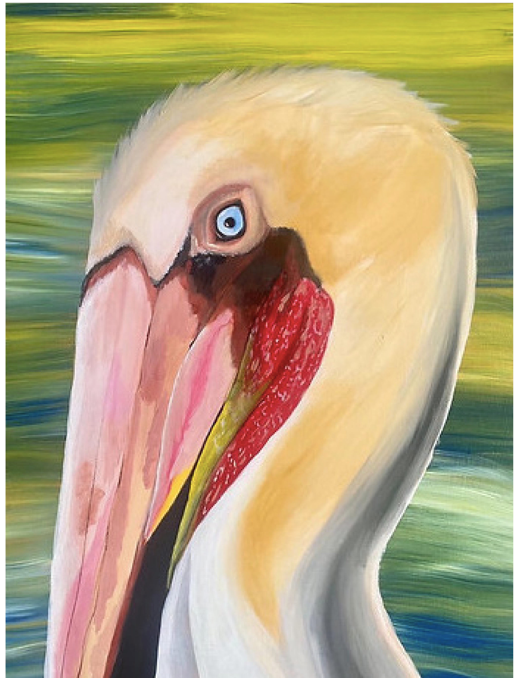
Pelicano (2023) Técnica: Tinta Acrílica Medidas: 90 cm x 70 cm