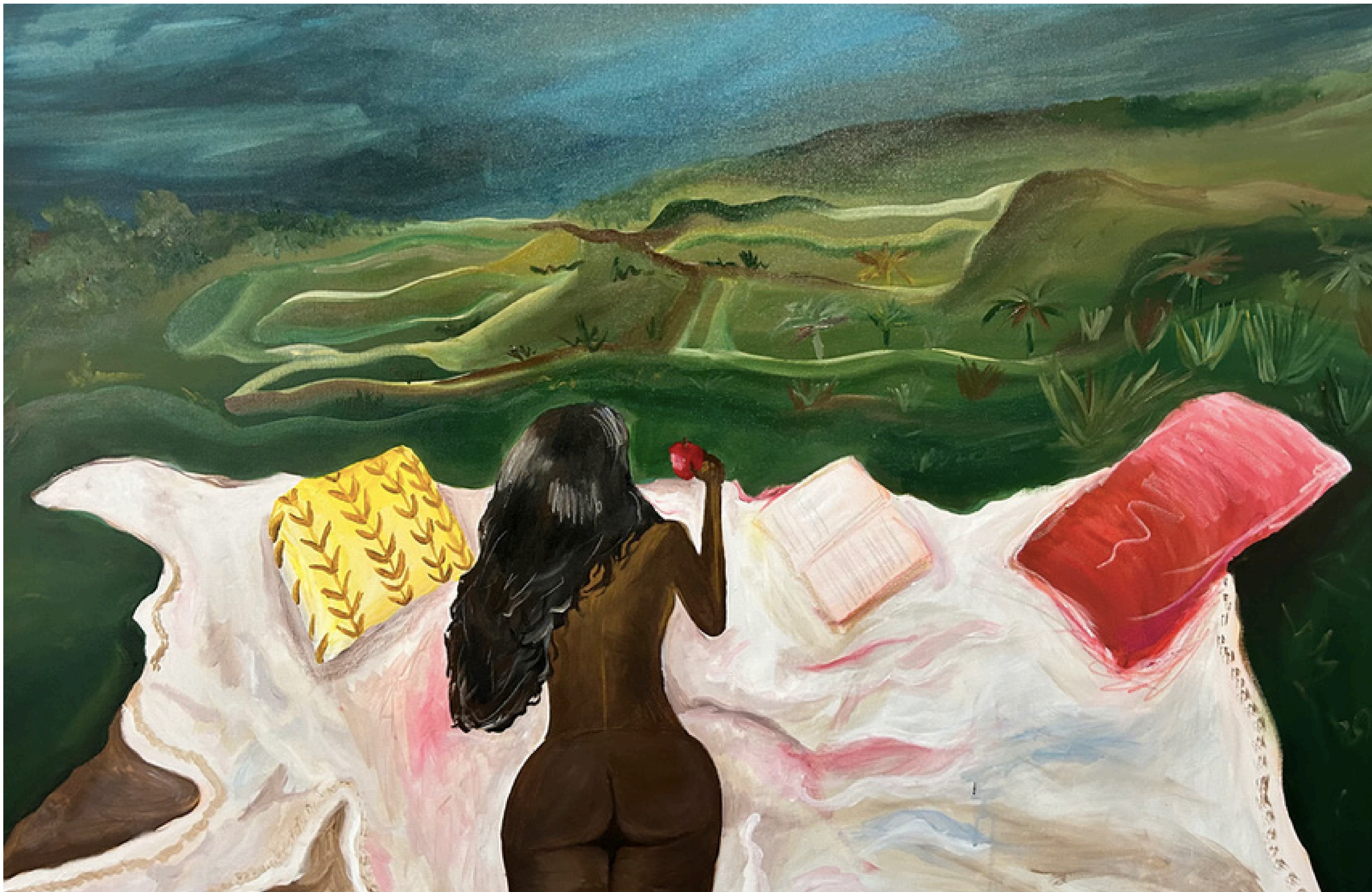
Jardim de Eva (2025)

Técnica: Tinta Acrílica e Giz Pastel Medidas: 80 cm x 125 cm