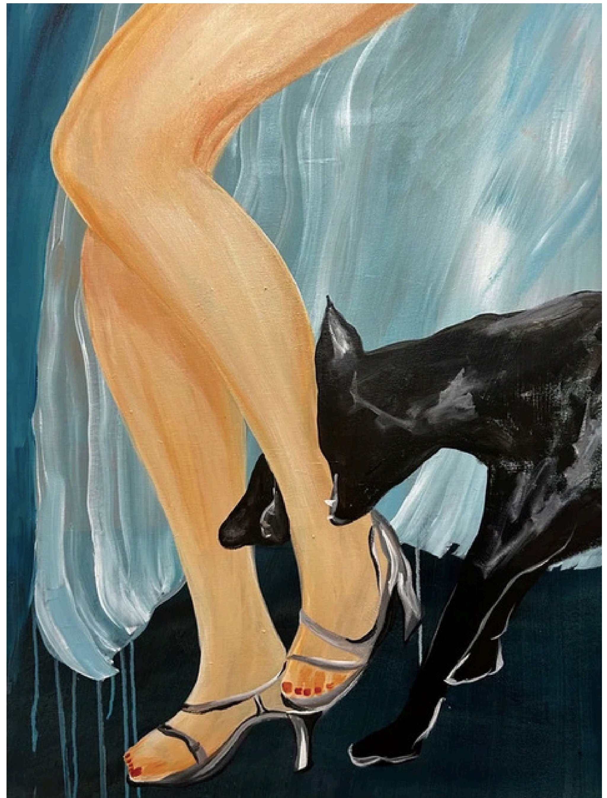
Pinscher (2024) Técnica: Tinta Acrílica Medidas: 80 cm x 60 cm