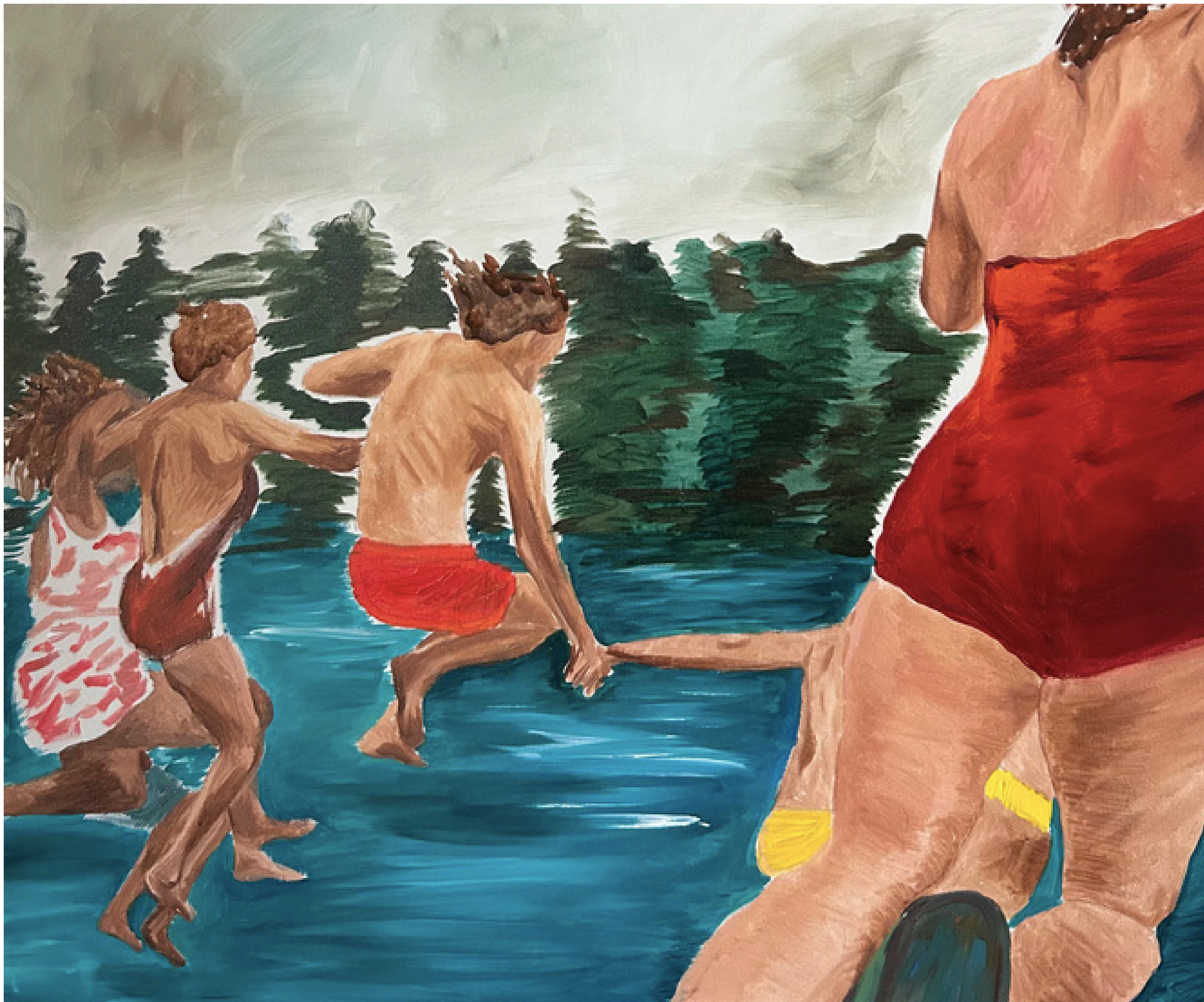
Desejo Indomesticado (2025)